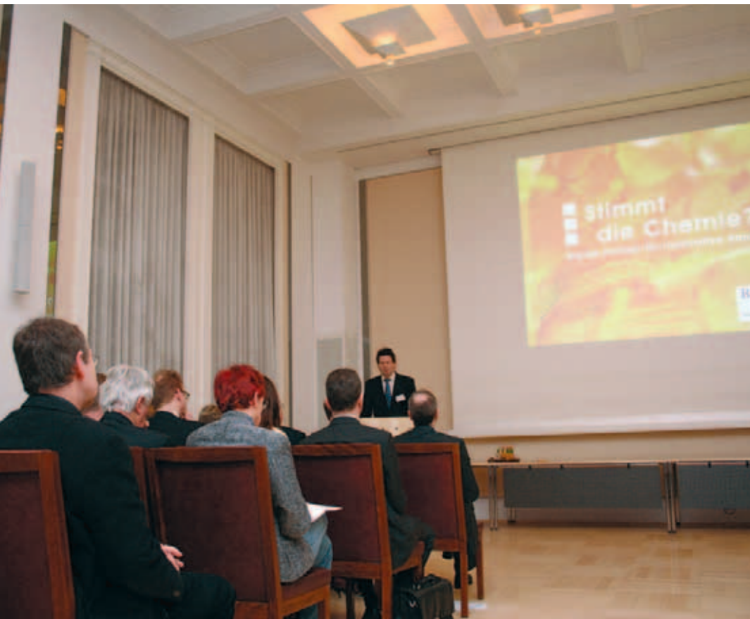
Beim „Matching-Abend“ stellen Gründer potenziellen Investoren ihre Konzepte vor.