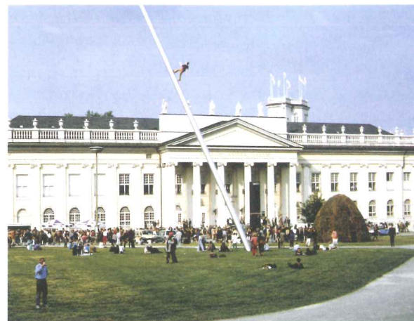
Abb. 2 Kassel, documenta 9, 1992, Friedrichsplatz mit Jonathan Borowsky, Man walking to the sky, 1991/92

Eine wichtige konzeptionelle Entscheidung hatte Hoet damit getroffen, dass er während des gesamten documenta-Sommers täglich das je zweistündige Format