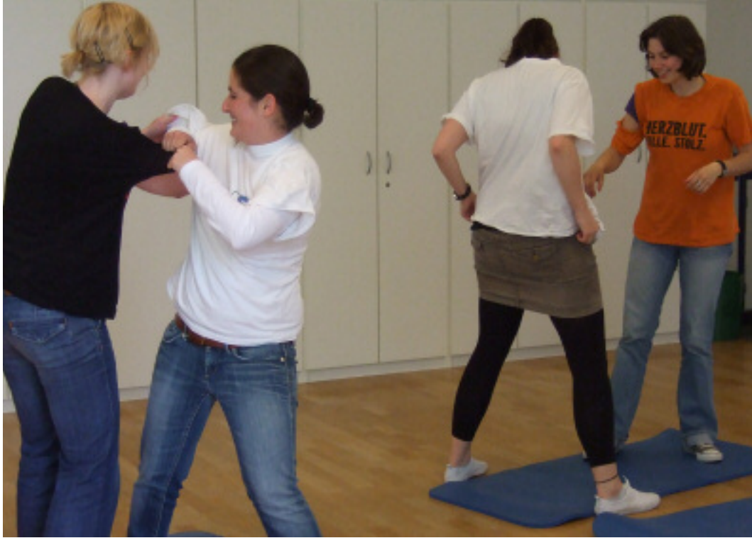
MM4 „Die Zerreißprobe“