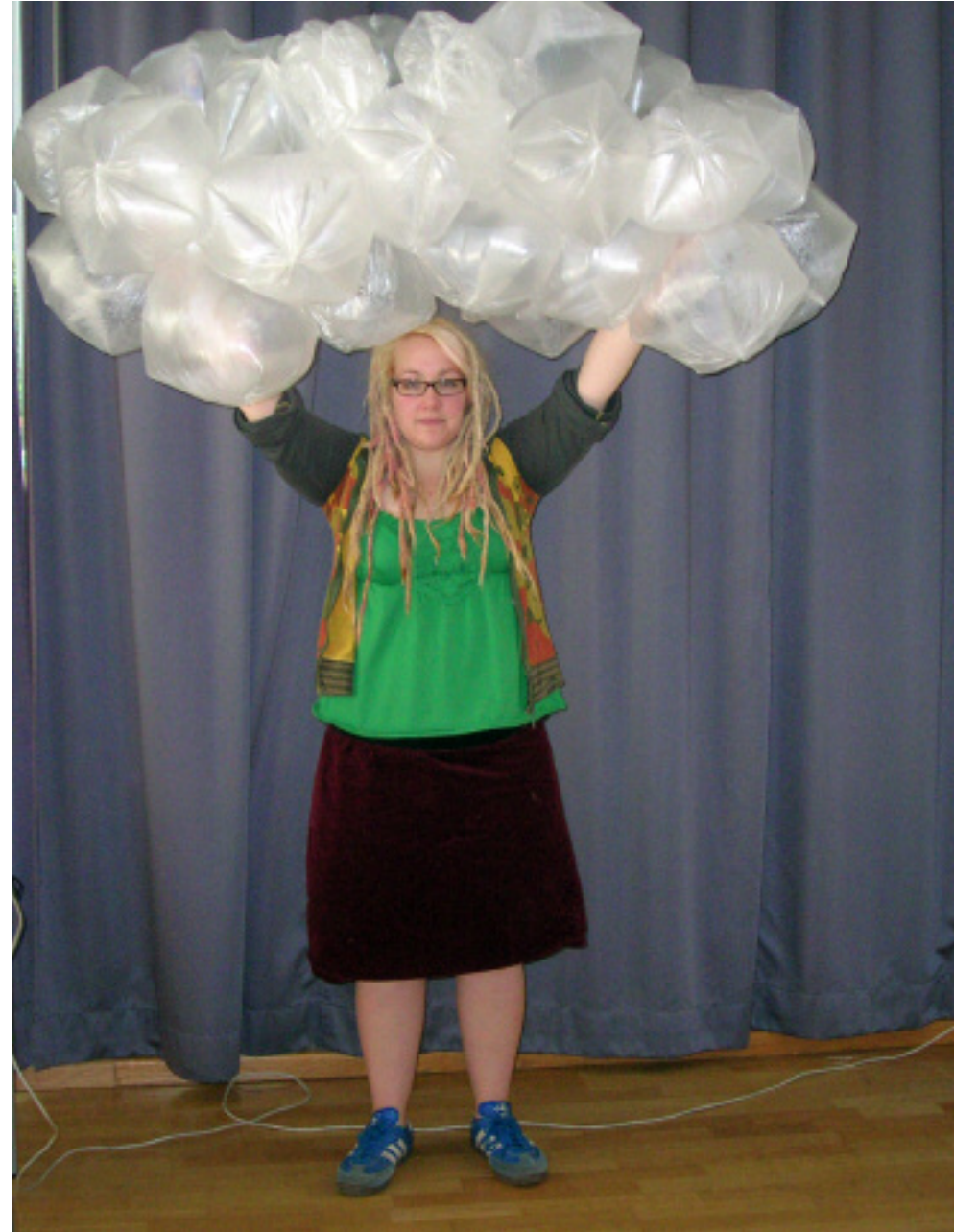
Materialexperimente - hier Plastiktüten