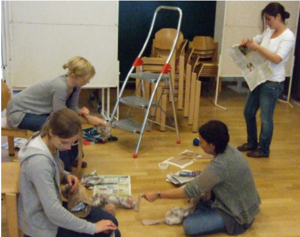
Fortsetzung der Zerreisprobe - Arbeiten mit dem veränderten Material