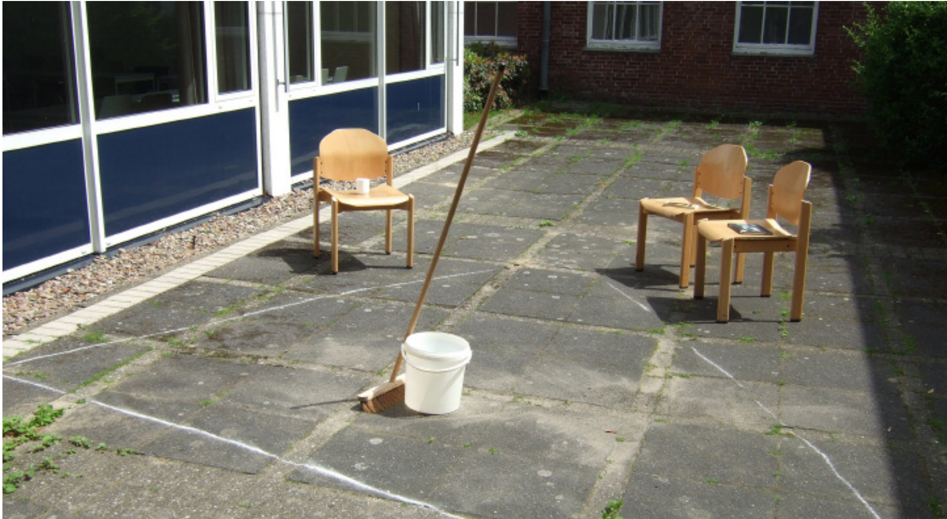
Projekte als Form der Lehre. Seminar (MM4/MM11/MM12) Sommersemester 2010